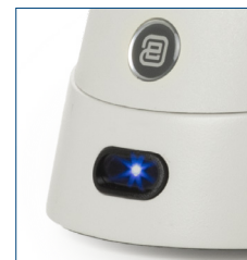
● Sensor iCare