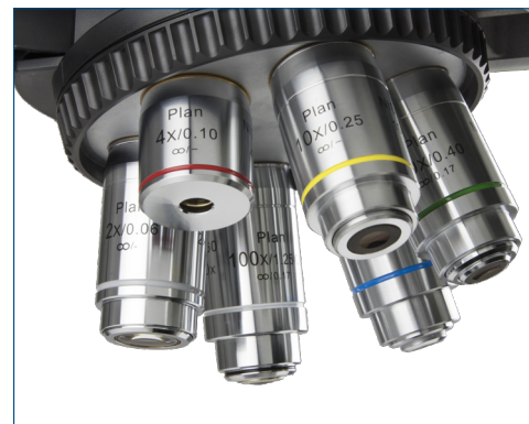
Sextuple nosepiece ●

Objetivos opcionales: Objetivo Plano acromático 2x/0.06 (distancia de trabajo 7.5 mm), Plano acromático S50x/0.95 (distancia de trabajo 0.19 mm), Plano acromático S60x/0.80 (distancia de trabajo 0.30 mm)